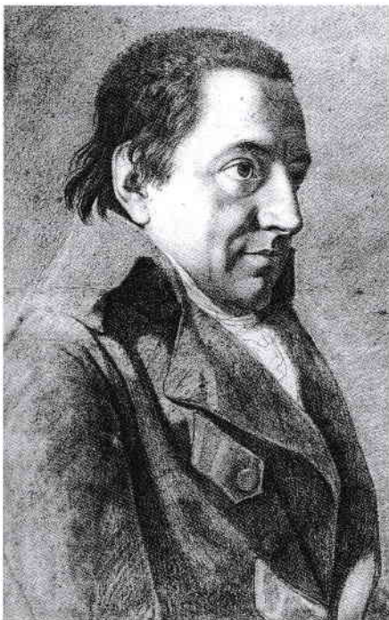
Portret al lui Johann Gottlieb Fichte realizat de pictorul german Friedrich Bury în 1801

distingea clar de celelalte popoare din vechea Europă [...].